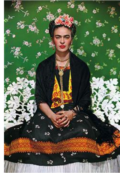
Nickolas Muray (American, 1892–1965). Frida on a White Bench , 1939. Carbon print, 15 3/4 x 10 3/4 in. The Jacques and Natasha Gelman Collection of 20th Century Mexican Art and the Vergel Foundation.