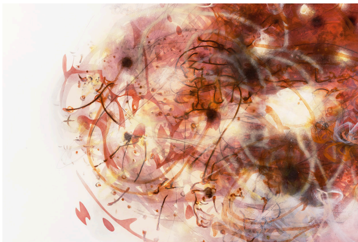
Fig. 3: The Red and the Red , 2014. Óleo y tinta sobre lienzo. Cortesía del artista y James Cohan Gallery. © Matthew Ritchie. Fotografía: Adam Reich

y asombrosamente conscientes. Las pinturas se derivan de redes generativas adversarias (GANs, por sus siglas en inglés), programas de inteligencia artificial que pueden ser utilizadas para deformar imágenes en nuevas formas sorprendentes.