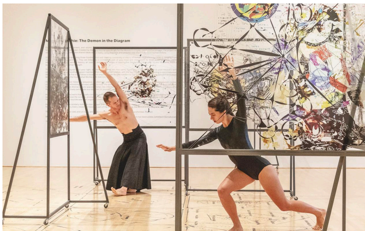
Fig. 5: Interpretación de The Exception to the Diagram (2018) con imagen de The Screen Game (2018) en The Demon in the Diagram , Moody Center for the Arts, Rice University, 2018.