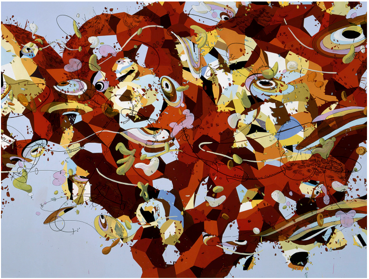
Fig. 1: M Theory , 2000. Óleo y tinta sobre lienzo. Colección del San Francisco Museum of Modern Art, donativo del artista. © Matthew Ritchie.

civilización por medio de fuerzas naturales o divinas. Actualmente, la amenaza de una inundación es real debido al cambio climático que está causando tormentas más intensas, la pérdida de costas, y el derretimiento de la placa de hielo. Si un jardín indica el origen, la inundación puede ser el presagio del final.