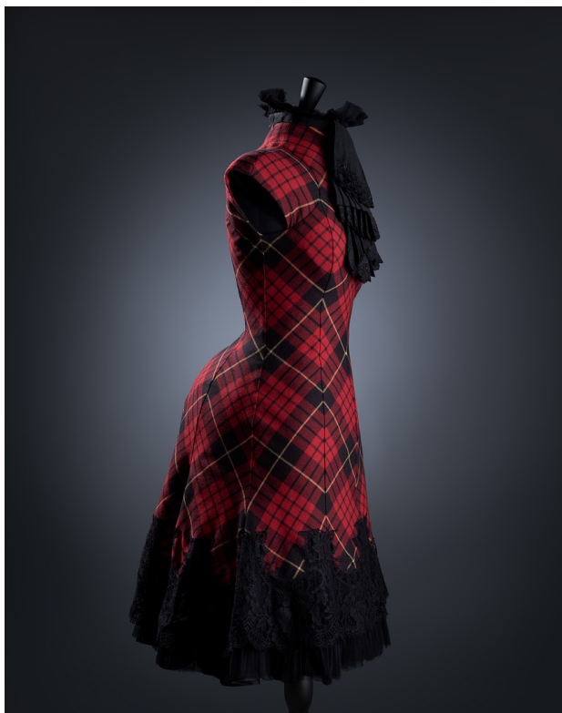
Alexander McQueen. Vestido en tela de tartán rojo y negro con encaje negro, de la colección Widows of Culloden (Viudas de Culloden), otoño/invierno 2006.