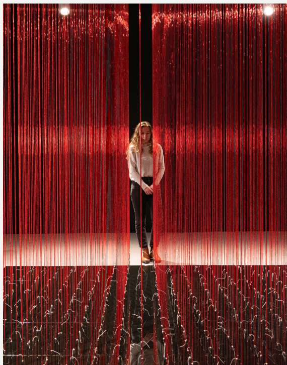
Fig. 4: Anila Quayyum Agha. A Flood of Tears (Gathering Storms) (Una Inundación de Lagrimas (Acumulando Tormentas)) (detalle, vista de la instalación), 2023. Agujas de tapicería, corneta, y cuentas de hematita, algodón trenzado, madera, acero, y vidrio; 144 x 144 x 156 pulgadas. Colección de la artista.

Interwoven presenta All the Flowers Are for Me (Red) (fig. 3), una caja de luz perteneciente al Museo de Arte de Cincinnati. La obra ejemplifica el uso dramático que hace Agha de la luz, el color y los motivos para crear significado, repleta de referencias a las tradiciones culturales pakistaníes. Sus efectos de luz moteada recuerdan a los jalis , las pantallas talladas y caladas con motivos ornamentales utilizadas en la arquitectura indo-islámica. Pero, mientras que los jalis sirven para separar a las mujeres de los hombres, Agha crea, por el contrario, un espacio inclusivo. En esta exposición, tanto las paredes como la caja de luz son de un brillante rojo rubí, que es el color típico de los vestidos de novia del sur de Asia debido a sus asociaciones