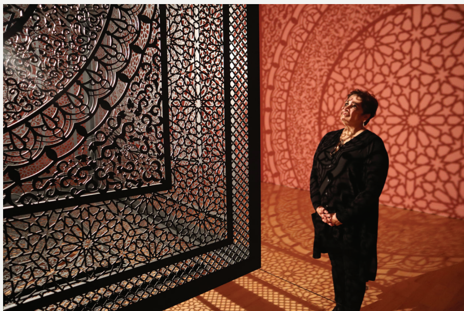
Fig. 2: Anila Quayyum Agha retratada con su instalación Intersections en 2019.

El viaje de Agha a la Alhambra en 2011 resultó ser un punto de inflexión importante en su carrera. El edificio es significativo no solo por ser uno de los ejemplos más exquisitos de la arquitectura islámica, sino también