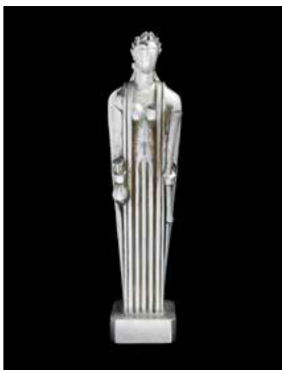
John Henry Bradley Storrs (Estadounidense, 1885–1956). Ceres , ca. 1928. Terracota niquelada, 20 1/4 x 4 3/4 x 3 7/8 pulgadas. Museo de Arte de Wichita, comprada por Friends of the Wichita Art Museum, 1987.7. © Estate of John Storrs

Los años entre las dos guerras mundiales fueron testigos de grandes cambios sociales, políticos y culturales en los Estados Unidos. Más de un millón de afroamericanos abandonaron el sur de los Estados Unidos en busca de oportunidades económicas e igualdad racial en ciudades del norte, centro y oeste del país; la mayoría de las mujeres obtuvieron el derecho a votar gracias a la Enmienda 19 de la Constitución en 1920, y muchos artistas adoptaron estilos modernos desarrollados en Europa usando nuevos materiales y técnicas de producción. Por medio de más de 140 obras de arte creadas de esta manera entre 1918 y 1938, la exposición American Art Deco: Designing for the People (Art Deco Estadounidense: Diseño para la gente) ofrece una oportunidad para enfocarnos en este período dinámico. Además, el amplio surtido de arte y decoración nos incita a pensar en el glamor y optimismo de ese momento en la historia de nuestro país, así como la devastación y discriminación que eran prevalentes.