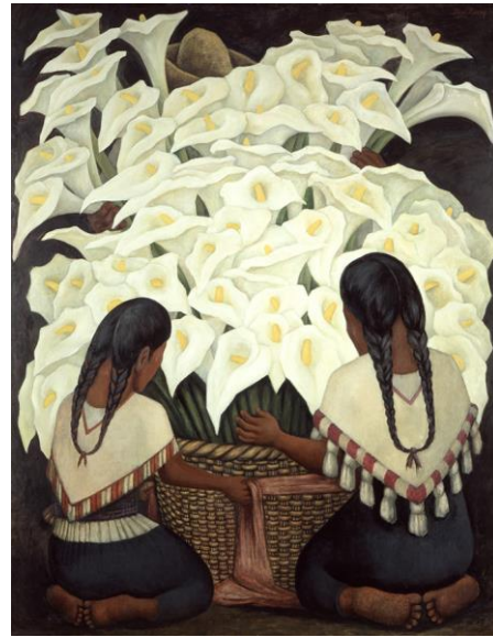
Diego Rivera (Mexican, 1886–1957). Calla Lily Vendor, 1943. Oil on Masonite, 59 x 47 1/4 in. The Jacques and Natasha Gelman Collection of 20th Century Mexican Art and the Vergel Foundation.

NASHVILLE, Tenn. (2 de abril, 2019)—El Frist Museo de Arte presenta Frida Kahlo, Diego Rivera y el Modernismo Mexicano de la Colección Jacques y Natasha Gelman —una exposición que captura la vitalidad y expresividad del arte mexicano del siglo XX con obras icónicas de Frida Kahlo, su esposo Diego Rivera y sus contemporáneos, entre ellos Manuel Álvarez Bravo, María Izquierdo, José Clemente Orozco y David Alfaro Siqueiros. Organizada por la Fundación Vergel y MondoMostre en colaboración con el Instituto Nacional de Bellas Artes y Literatura (INBAL), la exposición se exhibirá en la Galería Ingram del Frist el 24 de mayo hasta el 2 de septiembre de 2019.